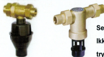
Selvirkende kontraventil Ikke kontrollerbare trykzoner

3 Nogen sundhedsfare – Skadelige stoffer Tilstedeværelse af skadelige stoffer